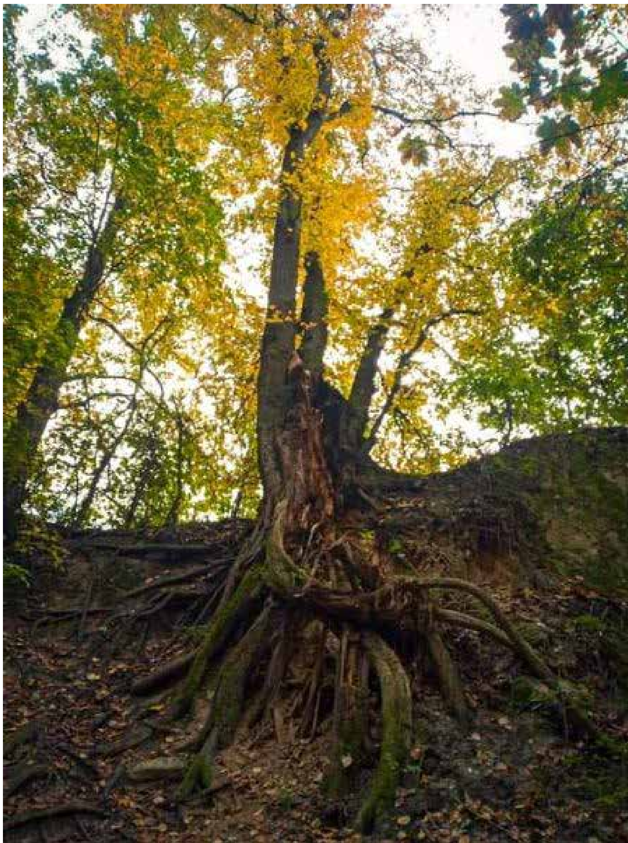
Wyróżnienie – Kinga Kopec