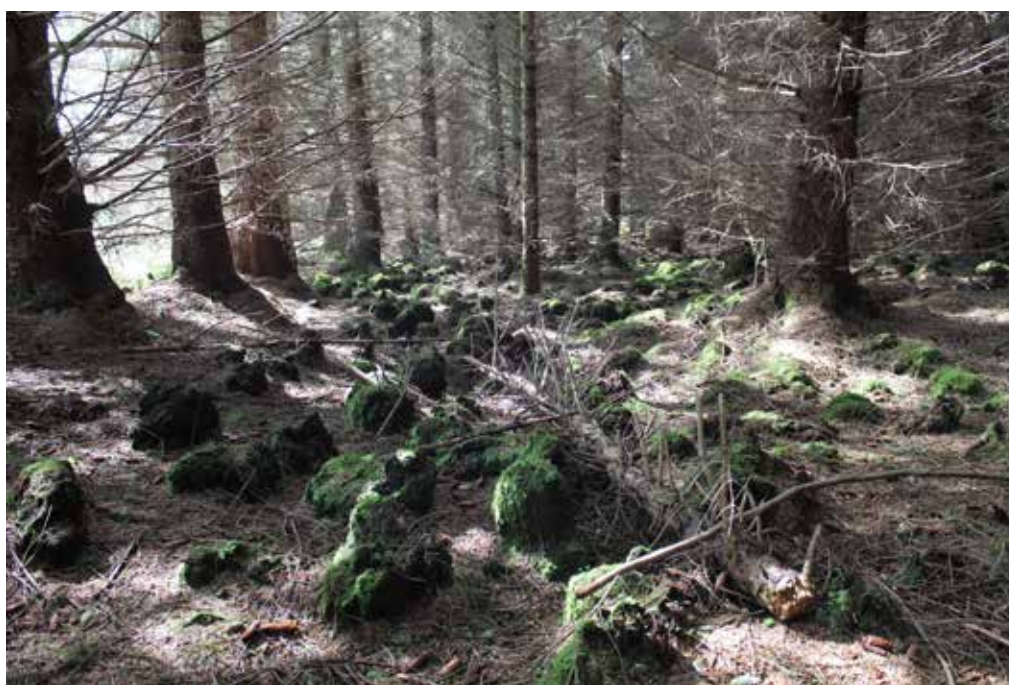
Konkurs na Facebooku: Mariusz Kowalczyk – las