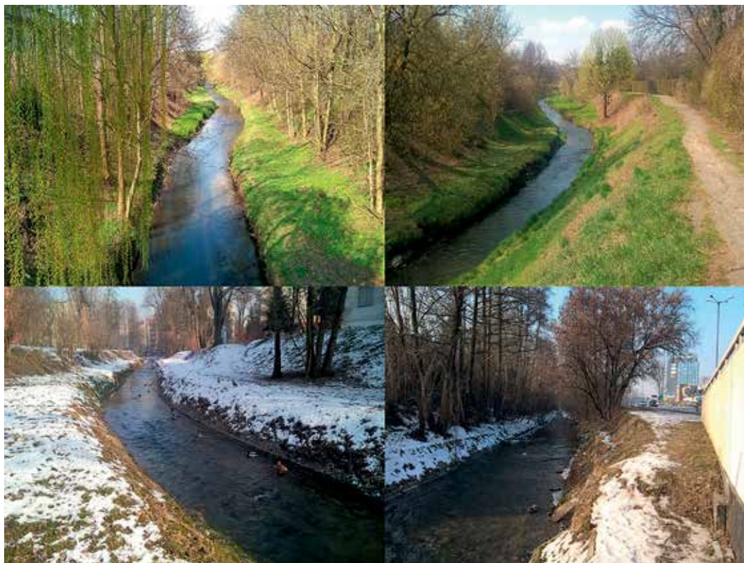
Ryc. 1. Rzeka Prądnik (w gminie Kraków zwany Białucha). Ruch kołowy powoduje podnoszenie się zalegającego na ulicach pyłu zawieszonoego poprzez turbulencje powietrza. W Krakowie powszechna jest emisja napływowa, czyli przywiewanie różnych zanieczyszczeń z okolic miasta. Systematyczne zabudowywanie spowodowało zmniejszenie naturalnego nawiewania świeżego powietrza i wywiewania zanieczyszczeń poza obręb aglomeracji i stało się barierą ekologiczną.

albo-fraglis) oraz nadrzeczna roślinność nitrofilna i ziołorośla nadrzeczne ( Convolvuletalia sepium ), a w dopływach do Wisły – szuwar mozgowy ( Phalaridetum arundinaceae ), charakterystyczny dla rowów melioracyjnych [4]. Nasadzenia roślin łągodzą