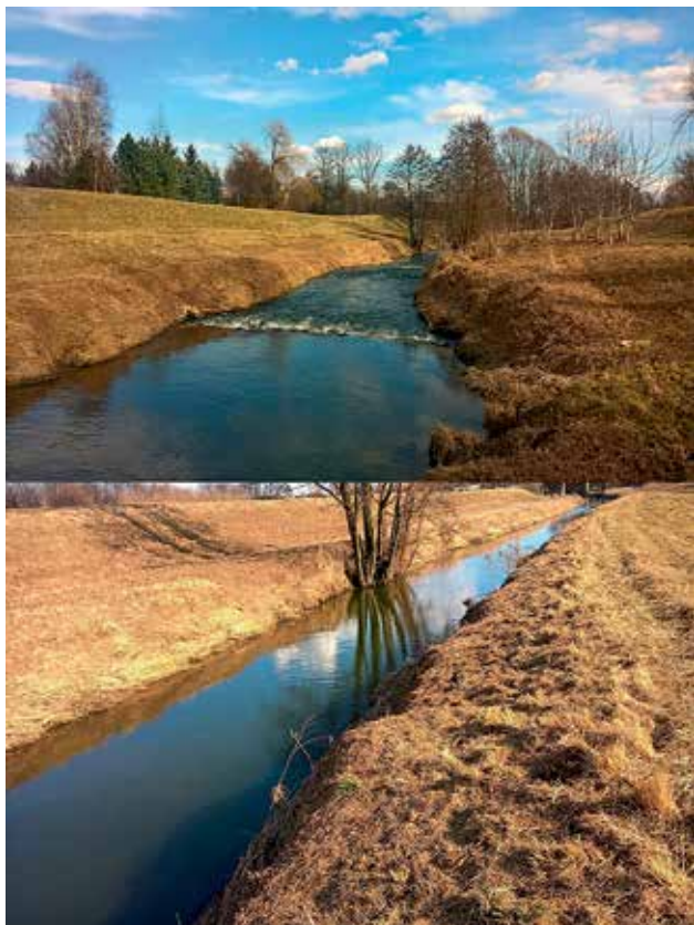
Ryc. 3. Rzeka Rudawa – mała rzeka wyżynna węglanowa. Doliny rzek miejskich są „korytarzami ekologicznymi”, stanowiąc kanały wentylacyjne dla powietrza w mieście. Umożliwiają też migrację różnych gatunków ptaków. Korytarze ekologiczne stanowią pasy roślinności wzdłuż dolin rzecznych i decydują o stopniu naturalności ekosystemu. Pełnią funkcje łącznika pomiędzy zbiorowiskami roślinnymi i są szlakiem komunikacyjnym dla zwierząt i grzybów. Fot. Wiktor Halecki.

z otoczeniem). Powietrze ochładza się o 0,98^{\circ}\text{C} w momencie osiągnięcia pułapu 100 m w górę [18].