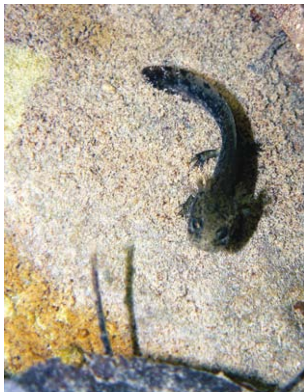
Ryc. 4. Salamandra salamandra .

mnianego wcześniej Hyperolius viridiflavus (Ryc. 2). Warto zaznaczyć, że jest to gatunek o prawdopodobnie największym zróżnicowaniu ubarwienia spośród wszystkich kręgowców. W jego obrębie wyróżnia się liczne podgatunki, znacznie różniące się wyglądem