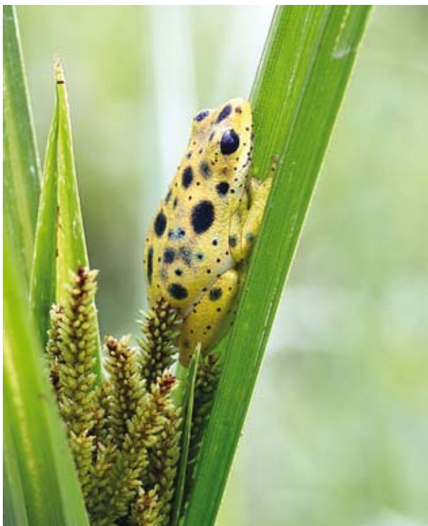
Ryc. 2. Hyperolius viridiflavus .

Wówczas, jeżeli w wyższych warstwach skóry nie znajdują się komórki zawierające barwniki, dla obserwatora płaz będzie miał barwę niebieską. Natomiast jeżeli powyżej guanoforów znajdują się ksantofory z żółtym pigmentem, dla obserwatora płaz będzie miał barwę zieloną (nastąpi nałożenie się barwy niebieskiej z żółtą).