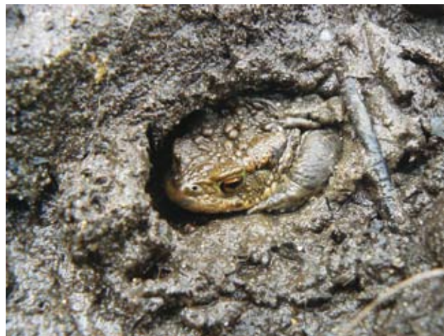
Ryc. 3. Bufo bufo .

Ubarwienie osobnika mające na celu jego ukrycie nosi nazwę ubarwienia kryptycznego (mimetycznego). Stanowi ono jedną z form ochrony przed drapieżnikami, wyrażającą się poprzez upodobnienie do zajmowanego siedliska pod względem barwy i desena. Ten rodzaj strategii można zaobserwować np. u azjatyckiego Theloderma corticale czy u wspo-