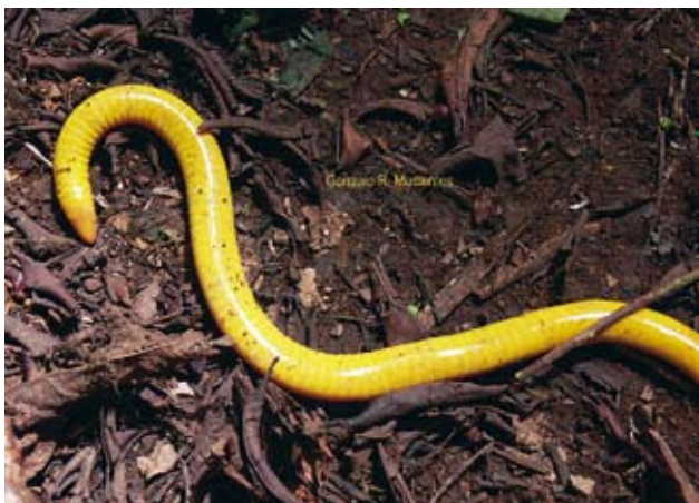
Ryc. 7. Schistometopum thomense .

w tym rzędzie płazów dotychczas nie zidentyfikowano trujących właściwości skóry osobników. Z krajowych gatunków typowo aposematyczne ubarwienie występuje u dorosłych osobników salamandry plamistej Salamandra salamandra . Na uwagę w tym względzie zasługują również nasze kumaki: kumak nizinny Bombina bombina i kumak górski Bombina variegata