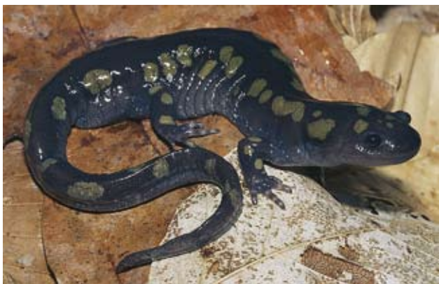
Ryc. 8. Ambystoma maculatum poza okresem godowym.

ta. Barwa spodu ich ciała pełni funkcje odstrasżające, natomiast strona grzbietowa jest mimetyczna. To ciekawy przykład obrony przed drapieżnikami poprzez łączenie dwóch form ubarwienia.