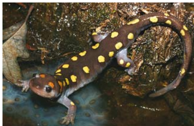
Ryc. 9. Ambystoma maculatum w szacie godowej.

się nowej). Ponadto, zwiększa ryzyko bycia zauważonym nie tylko przez samice swojego gatunku, ale i przez drapieżniki. Nie należy mylić ubarwienia godowego z ubarwieniem związanym z dymorfizmem płciowym, które także jest spotykane u płazów. Dymorfizm dotyczy stałych różnic w ubarwieniu samca i samicy, np. u Bufo canorus z Ameryki Północnej. Zmianę zabarwienia ciała w porze godowej można zaobserwować natomiast między innymi u północnoamerykańskiej ambystomy plamistej Ambystoma maculatum . Zwykle matowo-jasne plamy na grzbiecie samców (Ryc. 8) nabierają w tym czasie intensywnie żółtego zabarwienia (Ryc. 9). Przykładem gatunku, który zmienia zabarwienie całego ciała jest nasza krajowa żaba moczarowa Rana arvalis . Na go-