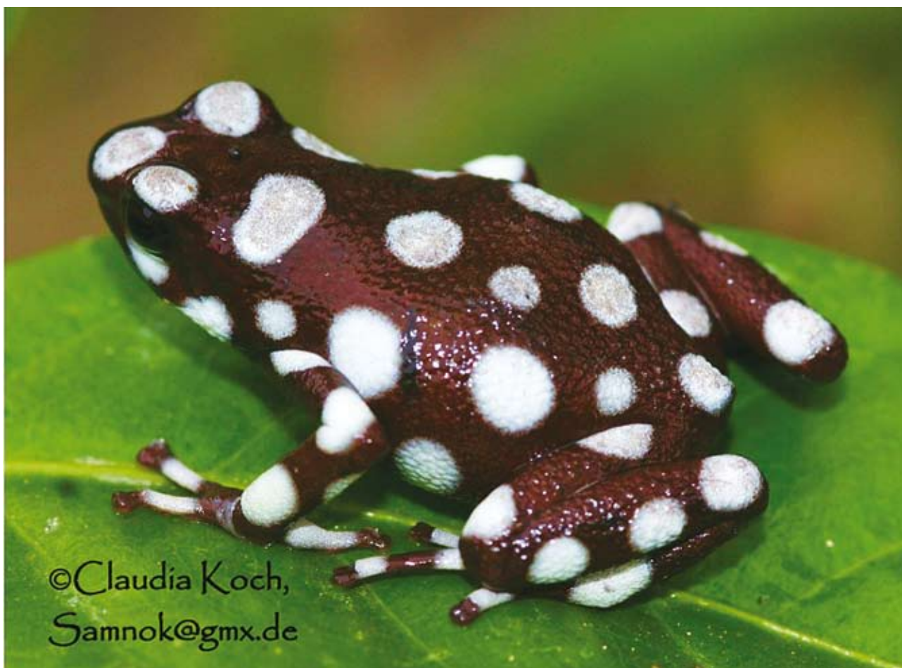
Ryc. 6. Dendrobates mysteriosus . Fot. Claudia Koch.

Ubarwienie mające na celu zwrócenie uwagi ma zwykle znaczenie ostrzegawcze lub godowe. Pierwsze – ostrzegawcze (aposematyczne) ma ostrzegać drapieżniki o trujących właściwościach osobnika, który odróżnia się od środowiska w jaskrawy, kontrastowy sposób. Najlepiej poznaną rodziną toksycznych płazów są drzewołazy, występujące w większości w wilgotnych lasach Ameryki Południowej. Dendrobates auratus (Ryc. 5) czy Dendrobates mysteriosus (Ryc. 6) nie ukrywają się przed drapieżnikami. Ich wrogowie łatwo zapamiętują, że są dla nich niejadalne. Wkrótce po schwytaniu płaza, zawarte w jego skórze alkaloidy powodują podrażnienie, co skutkuje zazwyczaj jego uwolnieniem. Intensywnie żółte zabarwienie ciała płaza beznogiego Schistometopum thomense (Ryc. 7) z afrykańskiej wyspy Sao Tome, wydaje się także pełnić rolę odstraszącą. Jednakże