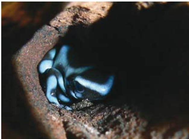
Ryc. 5. Dendrobates auratus .

i przy tym nie zawsze mimetyczne. Z polskich płazów, ubarwienie kryptyczne występuje np. u żab zielonych Pelophylax esculentus complex i u ropu-