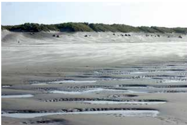
Ryc. 2. Widok Morza Wattowego. Dno morza odsłonięte podczas odpływu.

tworzy cztery rezerваты. Ponadto w części holenderskiej i niemieckiej utworzono Parki Narodowe. Największy i najstarszy z nich Schleswig-Holsteinisches o powierzchni 4410 km 2 jest największym parkiem narodowym w Europie Środkowej, a na jego powierzchni znajduje się trzeci pod względem wielkości na świecie obszar błotnisk pływowych.