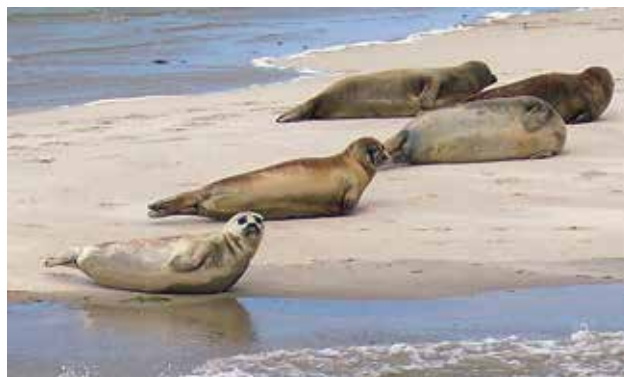
Ryc. 11. Foki szare na plażach przy Morzu Wattowym.

Szczególną atrakcją turystyczną, zwłaszcza w sezonie, jest rejs po morzu tradycyjnym, ponad stuletnim holenderskim żaglowcem. Ponieważ woda jest płyt-