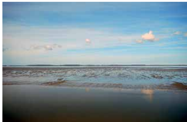
Ryc. 4. Widok Morza Wattowego.

Pod względem geologicznym Morze Wattowe jest bardzo młodym krajobrazem mającym zaledwie 10 000 lat. Do powstania Morza Wattowego, oprócz istnienia pływów, przyczyniło się kilka innych czynników, m.in. wyspy powstałe od strony otwarte-