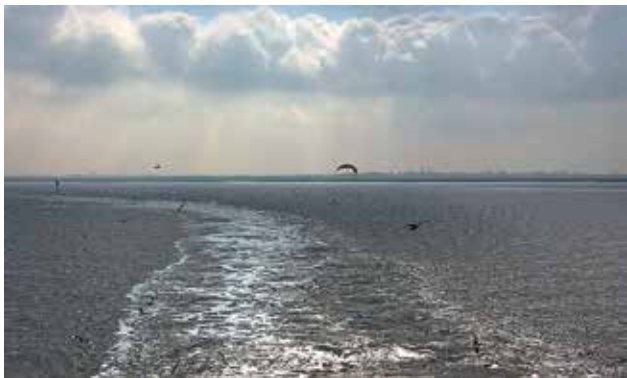
Ryc. 5. Ptaki unoszące się nad pływaczami.

będące wysoko wyspecjalizowanym ekosystemem przystosowanym do słonej wody. Kolejnym biotopem są watty, które stanowią wyjątkowe zjawisko przyrodnicze na świecie. W jednym metrze sześciennym wattu jest więcej biomasy niż w ana-