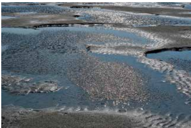
Ryc. 1. Widok Morza Wattowego.

Morze Wattowe (obszar wattowy) rozciąga się od wybrzeża Holandii, poprzez Niemcy po Danię, obejmuje południowo-wschodnią część przybrzeżnych terenów Morza Północnego, położone jest między kontynentem, a łańcuchem Wysp Fryzyjskich. Po stronie holenderskiej i niemieckiej Morze Wattowe