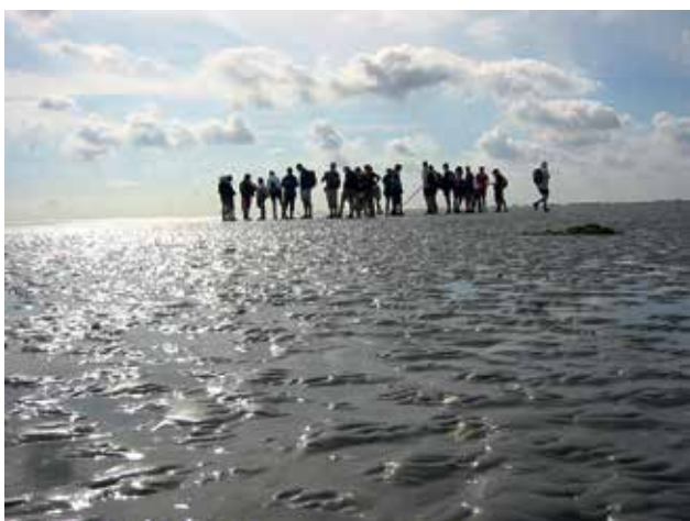
Ryc. 9. „Wycieczki wattów”.

Zróżnicowany charakter przyrodniczy sprawia, że żyje tutaj wiele gatunków ptaków.