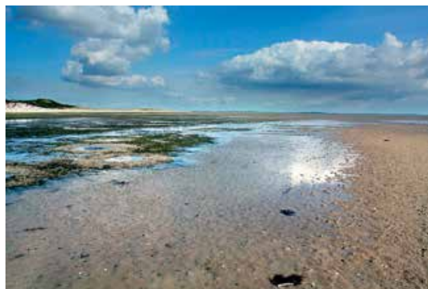
Ryc. 7. Widok Morza Wattowego.

Morze Wattowe jest płytkie. Promienie słoneczne sięgają samego dna, dzięki czemu woda szybko się nagrzewa. Stwarza to bardzo korzystne warunki do rozmnażania się planktonu, który jest ważnym ogniwem łańcucha pokarmowego. W wodzie żyje około 30 gatunków ryb, m.in. gładzice, flądry i dorsze. Jednak w ostatnich latach znacząco zmniejszyła się ich ilość. Coraz rzadziej pojawiają się tu łososie i płaszczyki, a o ponad połowę skurczyła się ilość wyławianych węgorzy. Powody zmniejszania się zasobów rybnych Morza Wattowego nie są do końca znane. Badacze sugerują, że wszystkiemu mogą być winne ruchy wydm, zmiany klimatyczne czy nadmierne rybołówstwo. Od kilku już lat istnieje całkowity