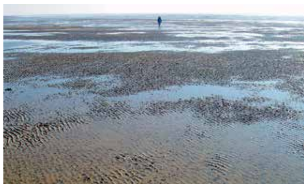
Ryc. 6. Widok Morza Wattowego.

przenoszone są niezliczone ilości wody morskiej. Piasek i woda piętrzone są przez wiatr, a ich wzajemne oddziaływanie kreuje krajobraz z wydrami, mierzynami, pływaczami i wyżłobieniami. Krajobraz ten nieustannie się zmienia. Magiczne spektakle, gdzie reżyserem jest sama natura.