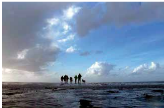
Ryc. 10. „Wycieczki wattów”. Fot. N. Jansen.

obrożne, gęsiówki egipskie, czarnowrony, czaple nadobne czy podgorzałki. Wśród większych z nich dominuje biernikla białolica, której całe stada żerują na łąkach. Obserwuje się kawki, drozdy, drapieżnego krogulca, sowy błotne zakładają tu swoje gniazda. Wattowe wybrzeża to ornitologiczny raj. Wymarzone miejsce dla ptaków wędrownych, zwłaszcza wiosną i późną jesienią. Niektóre z nich wykorzystują ten teren jako przystanek podczas migracji lub schronienie na czas zimowania, dla innych jest to miejsce odpoczynku przed dalszym lotem.