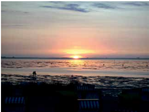
Ryc. 8. Widok Morza Wattowego.

Błotniska Morza Wattowego to świat małży, ostryg i krewetek. Tworzą one kolorowe dywany pokrywające warstwę ciemnego śluzu. Kraby i krewetki zakopują się w piasek, a jesienią opuszczają swoje błot-