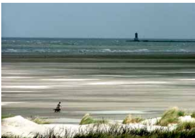
Ryc. 5. Widok Morza Wattowego.

logicznej ilości gleby tropikalnego lasu deszczowego. Najbliżej brzegu występuje watt iglasty, którego powierzchnia pokryta jest delikatnym materiałem. Występują tam przede wszystkim glony stanowiące pokarm dla ślimaków. Blżej wybrzeża powstaje watt mieszany z piaskiem, gliną i cząstkami organicznymi na powierzchni. W strefie, gdzie woda ma jeszcze dużą siłę, transportowane są ciężkie cząstki piasku i powstaje watt piaszczysty. Tworzące się w ten sposób piaszczyste wydmy są następnym biotopem.