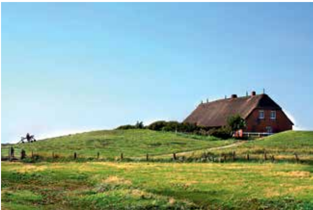
Ryc. 12. Wioska na wysepkach w pobliżu Morza Wattowego. Fot. N. Jansen.

i są regularnie przesuwane. Oznaczone bojami, ponadto bieżące informacje służb morskich pozwalają zachować należyte bezpieczeństwo.