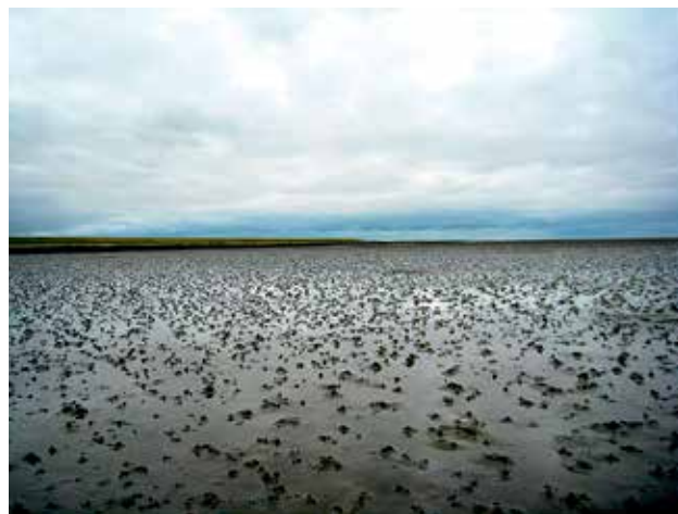
Ryc. 3. Widok Morza Wattowego.

przyptywów, a podczas odpływów odsłaniane. Sukcesywnie zamulane i zarastane przez roślinność bagienną, po wysuszeniu stanowią bardzo żyzne gleby. To one nazywają się wattami. Te rozległe równiny pływowe, nazywane także osuchami, mają około 450 km długości, a ich szerokość sięga między 10–30 km.