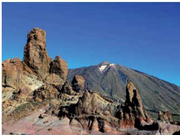
Ryc. 1. Szczyt Pico del Teide widziany z Roques de García. Po prawej stronie widać podpory i górną stację kolejki gondolowej, którą można wyjechać na wysokość 3555 m n.p.m., pokonując ok. 1200 m różnicy wzniesień w ciągu 8 minut. Szczyt stoi pośrodku ogromnej kaldery o obwodzie 48 km.

Wyspy Kanaryjskie to archipelag siedmiu większych i sześciu mniejszych wysp wulkanicznych na Atlantyku, należących do większego regionu wyspiarskiego znanego jako Makronezja („Wyspy Szczęśliwe”). Najbardziej wschodnie wyspy archipelagu (Lanzarote i Fuerteventura) leżą w odległo-