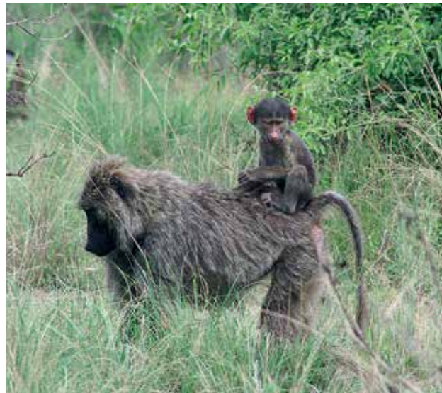
Ryc. 4. Samica pawiana oliwkowego Papio Anubis .

mahoni, jak brązowego Lavoa synnertonii i tiamy Entandrophragma angolense , czy innego drzewa Cordia millenia . Ogólnie rośnie tu ponad 250 gatunków drzew, w tym egzotyczne – sosna Pinus i eukaliptus Eucalyptus , w dużej mierze usunięte po ustanowieniu