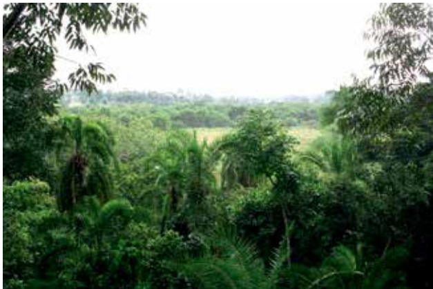
Ryc. 2. Niższe piętro lasu Kibale.

który zajmuje jego północną i środkową część na Wyżynie Fort Portal. Wznosi się ona powyżej 1100 m n.p.m., przy czym najwyższym wzniesieniem jest Kibale (1590 m), które dało nazwę Parkowi. Roczne opady dochodzą tu w najwilgotniejszej porze – ma-