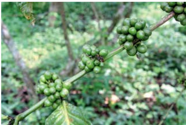
Ryc. 6. Dziki kawowiec.

ter mają też badania dendrologiczne i leśne, w tym prowadzone przez terenową stację badawczą Uniwersytetu Mkarere. W Parku rośnie dziko kawowiec robusta Coffea robusta , co skłoniło pewne firmy i instytucje ugandyjskie do zakładania jego plantacji dla wzbogacenia oferty krajowego rolnictwa i wzmocnienia eksportu.