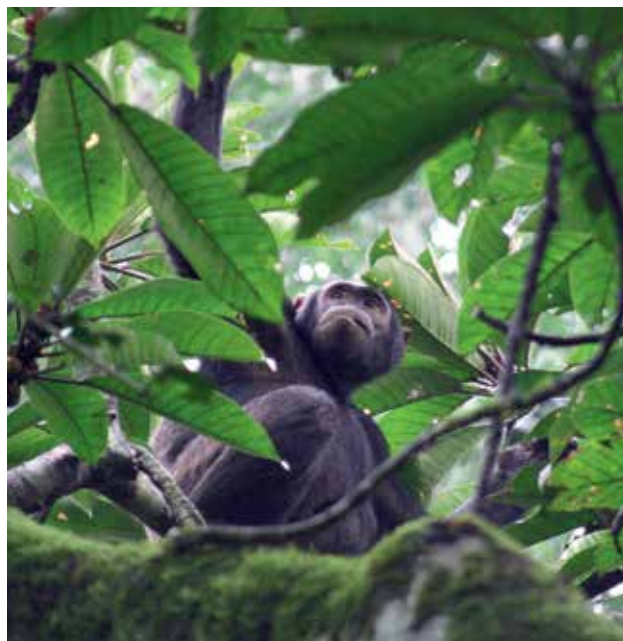
Ryc. 9. Szympana na figowcu.

Okolice Parku zamieszkują plemiona Batooro i Bakiga, które wdarły się w drugiej połowie XX w. głęboko w las, karczując go na potrzeby swojego prymitywnego rolnictwa. Z jednej strony niszczyło to siedliska wymienionych i innych zwierząt, z drugiej – uruchomiło erozję, która przy tak intensywnych opadach przybiera nader intensywne rozmiary. Niemniej jednak półpaństwowy zarząd terenami chronionymi Uganda Wildlife Authority pozwala im na ograniczone korzystanie z zasobów Parku, w ścisłym oczywiście uzgodnieniu. Pomocą dla miejscowej ludności staje się rozwijana turystyka, dla potrzeb której powstają kolejne ośrodki noclegowe zwane lodge , a przy okazji sieć handlowa, w tym pamiątek – rzadko, niestety, w miarę oryginalnych. Na szczęście, przyroda jest nadal wspaiała.