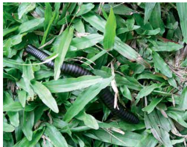
Ryc. 5. Krocionóg Tachypodoiulus niger .

Parku. W bogatych, trudnych do przebycia niższych piętrach na uwagę zasługują Palisota schwenfurthi z rodziny komelinowatych i nader oryginalna Pollia condensata , tej samej przynależności taksonomicznej. Wyróżnia się – w skali światowej! – jagodami intensywnie niebieskimi i silnie błyszczącymi nawet po wyschnięciu. Zniszczenie wielu połączy drzewostanów naprawiane jest w ramach szeroko zakrojonego planu regeneracji lasu na powierzchni 6213 ha, także pod kątem zmniejszenia obecności dwutlenku węgla w atmosferze i przeciwdziałania erozji. Do nasadzeń używa się zwłaszcza Albizia gummifera z rodzaju Mimosaceae oraz Bridelia micrautha i Croton megalocarpus z rodzaju Euphorbiaceae . Rozległy charak-