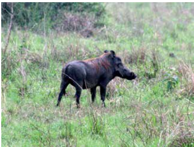
Ryc. 3. Guziec.

rzec – maj i wrzesień – listopad, aż do 1700 mm przy temperaturach 14–27 °C. Te ostatnie rosną ku południowi zgodnie ze spadkiem górzystego terenu do dna Zachodniego Ryftu – potężnego rowu tektonicznego, zachodniej „odnogi” Wielkiego Ryftu Afrykańskiego. Tu też Park łączy się leśnym korytarzem