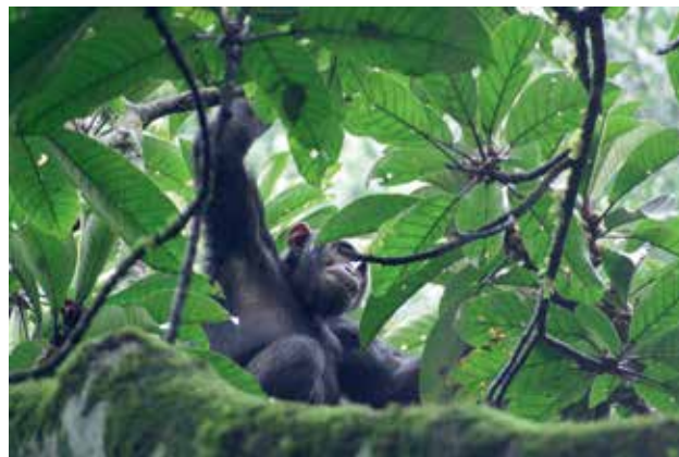
Ryc. 8. Szympan na figowcu.

małp, w tym naczelnych Primates (największa koncentracja naczelnych w Afryce). Ptaków stwierdzono aż 325 gatunków, w tym rzadkie, jak endemiczny tu drozd szarogrzbietowy Turdus kibalensis , kurtaczek zielonopierśny Pitta reichenowi , czy też papuga popielata Psittacus erithacus , zwana też szarą lub żako kongijskim – jedyny przedstawiciel rodzaju Psitta-