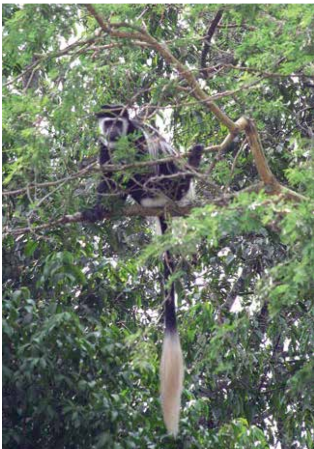
Ryc. 7. Gereza abisyńska.

Tak rozwinięty świat roślin daje znakomitą bazę żywnościową i schronienie licznym gatunkom zwierząt. Korzysta zeń 60 gatunków ssaków, w tym 4 gatunki kotowatych Felidae i kilkanaście gatunków