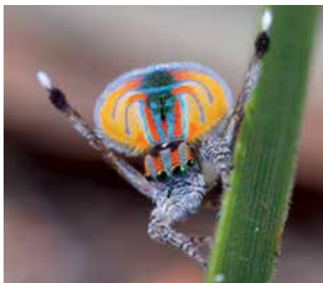
Ryc. 3. Maratus volans w sekwencji tańca.

Corythalia canosa ( Anasaitis canosa ), skakun żyjący w południowej części Stanów Zjednoczonych i w Meksyku, posiada w swoim repertuarze około 30 głównych sekwencji, które mogą być łączone na wiele różnych sposobów. Różnice jakie możemy zaobserwować w zachowaniach pomiędzy poszczególnymi gatunkami skakunów to czas ekspozycji walorów samca, ale również wielkość samych repertuarów tanecznych, złożoność ich sekwencji oraz dokładność.