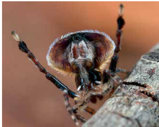
Ryc. 5. Opistosoma z widocznymi fałdami u Maratus volans.

rozrodczą. Zaloty te nie mają związku z aparatem wzroku pajaków, ponieważ gniazda budowane są zazwyczaj w miejscach bardzo ciemnych. Należy jednak dodać, że ten sam osobnik, który wykorzystywał wcześniej zaloty w formie sygnalizowania gotowości