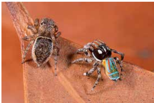
Ryc. 4. Zbliżenie do samicy i ostatni etap zalotów. Maratus volans podczas tańca poprzedzającego kopulację.

Dodatkami do wizualnego przedstawienia samca mogą być feromony oraz wydawanie dźwięków – strydulacja. Innym ze sposobów komunikacji między samcem i samicą są wibracyjne sygnały wysyłane przez sieć pajęczą. Co prawda, skakuny nie tworzą sieci typowych dla innych pajaków, które służą im jako pułapki na ofiary, ale przędą kokonopodobne