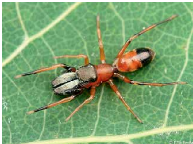
Ryc. 8. Mrówczyńska ( Myrmarachne formicaria ) – gatunek występujący także na terenie Polski.

w samicy. To właśnie na nogogłaszczkach u samców pajaków znajduje się organ rozrodczy. Budowa nogogłaszczek u pajaków jest analogiczna do ogólnej budowy odnóży bezkręgowców, z tym że ostatni człon, czyli stopa ( tarsus ) nie jest członowana. U dojrzałych