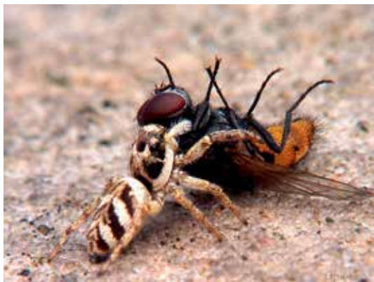
Ryc. 7. Skakun arlekinowy ( Salticus scenicus ) z ofiarą.

zygzakowate zbliżanie się do samicy oraz typową pozycję do zbliżenia się z samicą. Po czym wspinają się one na wybrankę w celu połączenia się w „miłosnym uścisku”. Gdy samiec wejdzie na odwłok samicy, odwraca się o 180° tak, aby jego prosoma znajdowała się nad opistosomą partnerki. Osobniki zwrócone są w przeciwnych kierunkach. Samiec chwytą i podnosi odwłok samicy przednimi odnóżami, jednocześnie obracając je zgodnie lub przeciwnie do kierunku wskazówek zegara. Odwłok samicy obrócony zostaje w prawo, kiedy koniec lewej nogogłaszczki zostaje wprowadzony, w lewo natomiast, kiedy prawy koniec nogogłaszczki zostaje umieszczony przez samca