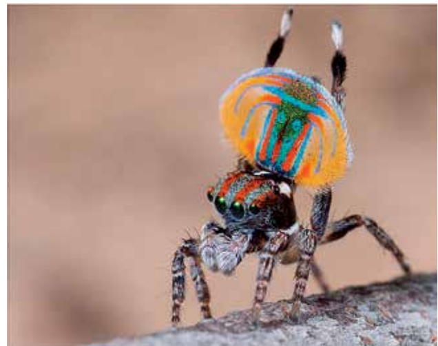
Ryc. 2. Gatunek australijskiego skakuna Maratus volans podczas zalotów (widoczne zachowanie wibracyjne).

a największe osiągają 22 mm długości. Zaliczane są do grupy pajaków właściwych lub tzw. „wyższych” ( Araneomorphae ). Na Ziemi dotychczas opisano 5812 gatunków, co stanowi ponad 13% wszystkich gatunków pajaków świata. Dzięki badaniom odkrywano są nowe gatunki i od 2013 roku (znano 5600 gat.) ich liczba wzrosła o 212. Nasza krajowa fauna licząca 59 gatunków skakunów jest bardzo uboga, gdyż stanowi zaledwie 1% fauny światowej. Najczęściej możemy spotkać skakuna arlekinowego ( Salticus scenicus ) na ścianach budynków, płotach oraz na pniach drzew lub mrówczynkę ( Myrmarachne formicaria ) wyglądem przypominającą robotnicę niektórych gatunków mrówek. Również inne gatunki skakunów, jak np. z rodzaju Leptorchestes i Synageles naśladują mrówki, a jeszcze inne – muchówki, zaleszczotki, chrząszcze oraz inne gatunki pajaków.