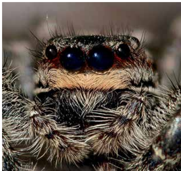
Ryc. 6. Skakuny posiadają trzy pary oczu leżące w trzech rzędach (4+2+2). Na zdjęciu u samicy widoczna jest środkowa para odpowiedzialna za widzenie stereoskopowe oraz dwa mniejsze po bokach odpowiedzialne za rejestrowanie zmian w natężeniu światła.

U większości pajaków, w tym także u skakunów, samce są mniejsze od samic i żeby doszło do aktu płciowego wykazują one najpierw kilka typowych dla siebie zachowań, takich jak unoszenie odnóży,