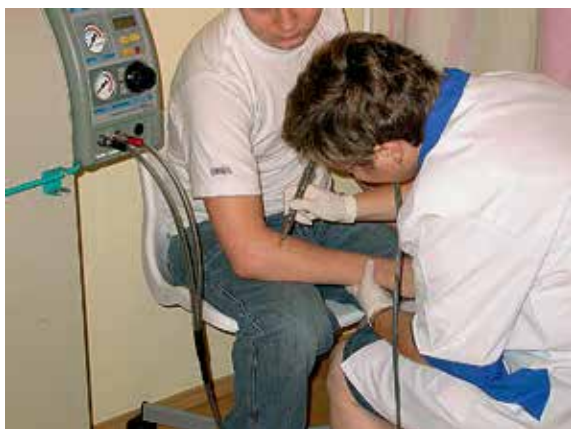
Ryc. 4. Zabieg kriochirurgii estetycznej (wymrażanie zmian skórnych).

komórki ulega krystalizacji. Następuje pęknięcie błon biologicznych i w konsekwencji destrukcja tkanki. Kriochirurgie stosuje się m.in. w dermatologii, onkologii, gastrologii, kardiologii, ginekologii oraz okulistyce. Dotychczasowe badania i praktyka wskazują, że wstępne wymrażanie może być z powodzeniem stosowane w wielu chorobach skóry i błon śluzowych. W zależności od stopnia znamion chorobowych na skórze stosuje się różne metody. Do niewielkich zmian chorobowych wystarczy tampon zanurzony w ciekłym azocie, większe ogniska chorobowe (o średnicy nie przekraczającej 2 cm) muszą być nartykiwane oparami azotu, zaś w trudnodostępnych miejscach używa się specjalnej rury aplikacyjnej (średnica 2,5–18 mm), która zawiera podtlenek azotu i ciekły azot. Zabiegi trwają kilka minut (średni czas 3–6 min) i są stosunkowo tanie (litr ciekłego azotu to koszt około 4 zł). Wymrażanie jest jednym z procesów krioblacji, w której, przy pomocy specjalnej końcówki w cewniku, wymraża się określone komórki. Metoda ma wysoką skuteczność i jest stosowana również w leczeniu raka. W przypadku zwyrodnień, takich jak brodawki łojotokowe lub ropne zapalenie gruczołów potowych, mogą wystąpić komplikacje – dolegliwości bólowe po zabiegu. Jest to jednak