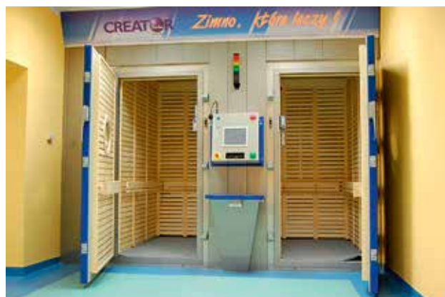
Ryc. 1. Przykład kriokomory.

Krioterapia ogólnoustrojowa jest obecnie jedną z najlepszych form leczenia kriozabiegami. Wchodzi w skład kinezyterapii (leczenia ruchem, tzw. gimnastyki leczniczej). Całość jest znana pod nazwą kriorehabilitacji. Krioterapia jest pierwszym jej elementem. Polega na krótkotrwałym, trwającym do trzech minut, pobudzaniu organizmu temperaturą poniżej -120^{\circ}\text{C} , działającą na całą powierzchnię ciała, celem wywołania odruchów fizjologicznych układowych i narządowych korzystnych dla przywracania homeostazy w organizmie. Odbywa się to w komorach przystosowanych specjalnie do tego celu. Termin krioterapia został po raz pierwszy użyty w 1908 r. przez A.W. Pusey'a, jednak pierwszą przypominającą znane kriokomory zaprojektowano w 1978 r. w Japonii. Podczas wystawiania organizmu na ekstremalnie niskie temperatury (poniżej 120–160 stopni Celsjusza) ważne jest przestrzeganie ściśle określonych procedur. Do