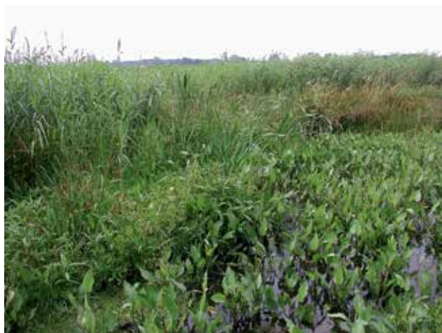
Ryc. 6. Łąki Skoszewskie z bagnistymi łąkami.

składającą się z obszernego terenu bagnistych łąk na wschodnim brzegu Zalewu Szczecińskiego. Przebiega przez niego wiele kanałów i rowów, przecinających liczne zadrzewienia olszowe i las olchowo-sosnowy. Jest to jedyne miejsce na całej długości