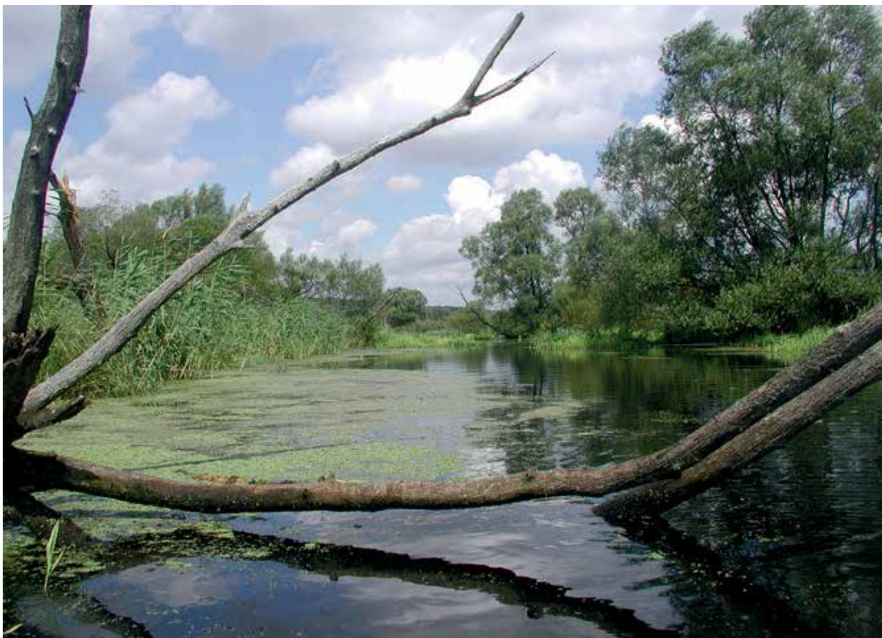
Ryc. 10. Rozlewiska Odry.

jeziorkami, która jest okresowo zalewana. Obszar Doliny Dolnej Odry bogaty jest w roślinność wodną, bogatą florę roślin naczyniowych z licznymi gatunkami chronionymi.