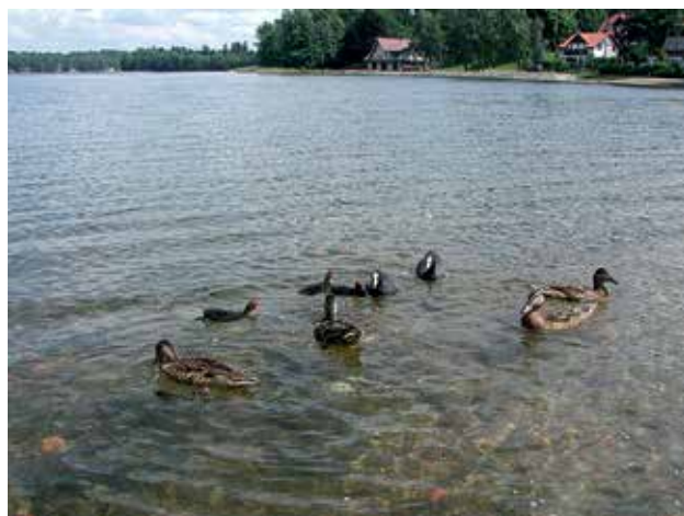
Ryc. 23. Unikatowe walory przyrodnicze obszarów Natura 2000 – kaczki krzyżówki i łyski.