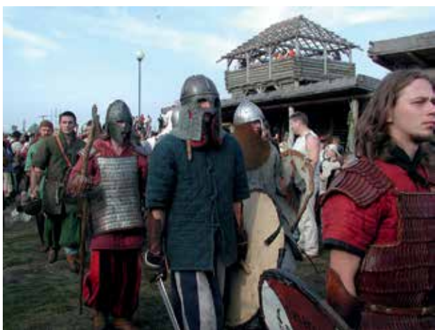
Ryc. 16. Festiwal Wikingów na Wolinie.

tu też można przy ogromnym szczęściu – przy brzegu morza – fokę szarą lub morświna.