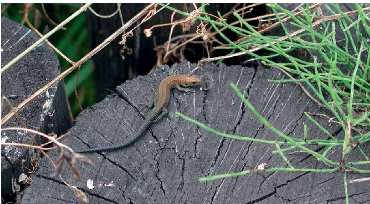
Ryc. 21. Unikatowe walory przyrodnicze obszarów Natura 2000 – jaszczurka.