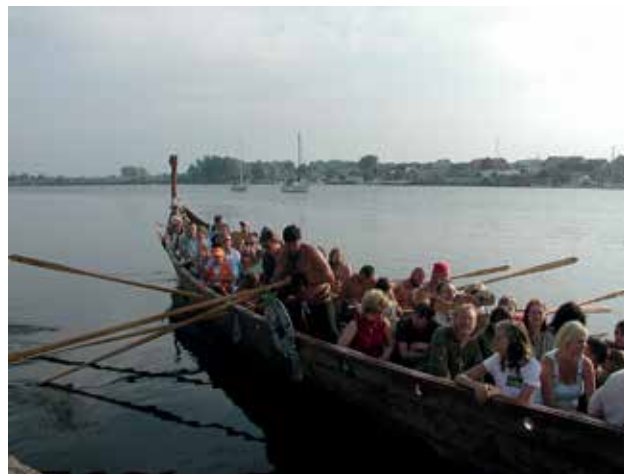
Ryc. 17. Festiwal Wikingów na Wolinie.

zasięg parku o pas wód przybrzeżnych o szerokości 1 mili, zarówno po stronie morza, jak i zalewu. Od tej chwili woliński park stał się pierwszym w Polsce parkiem morskim. Trzeba wspomnieć, że Wolin jako osada istniał już przed rokiem 963. To tutaj w lipcu