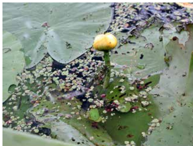
Ryc. 8. Grązel żółty.

Kiedy pojechać do Świdwia i co tam oglądać? W sierpniu najlepiej wybrać się nad jezioro wcześniej, pomiędzy 4 a 8 rano. O świcie z jeziora wylatuje na żer wiele gatunków ptaków, jak pliszki, potrzosy, makolągwy. Z kolei rano z nocnego żerowania wracają kaczki: krzyżówki, cyraneczki, krakwy. Możemy