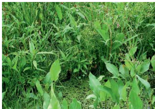
Ryc. 5. Bagna Rozwarowskie – podmokła pocięta kanałami dolina.

Bagna Rozwarowskie (Ryc. 5) to obszar o powierzchni 4211 ha, obejmujący podmokłą, pociętą kanałami dolinę rzek Grzybnica i Wołczenica. Na większości obszaru prowadzi się przemysłową hodowlę trzciny, występują tu również podmokłe łąki,