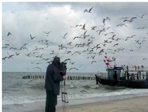
Ryc. 1. Mewy towarzyszące kutrom rybackim.

Przybrzeżne Wody Bałtyku, to obok Zatoki Pomorskiej, ważna ostoja ptasia o randze europejskiej, gdzie skupiają się kaczki morskie, nury i uhli. Zimują tu w znacznych ilościach dwa gatunki ptaków z Załącznika I Dyrektywy Ptasiej: nur czarnoszyi i nur rdzawoszyi. Kutrom rybackim towarzyszą tu liczne mewy. Obserwowane są ich duże koncentracje, m.in. mewy siodłatej, szacowane na kilka tysięcy sztuk (Ryc. 1).