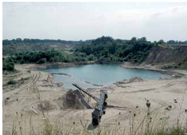
Ryc. 18. Kopalnia piasku i żwiru.

odbywa się coroczny Festiwal Słowian i Wikingów (Ryc.16–17).