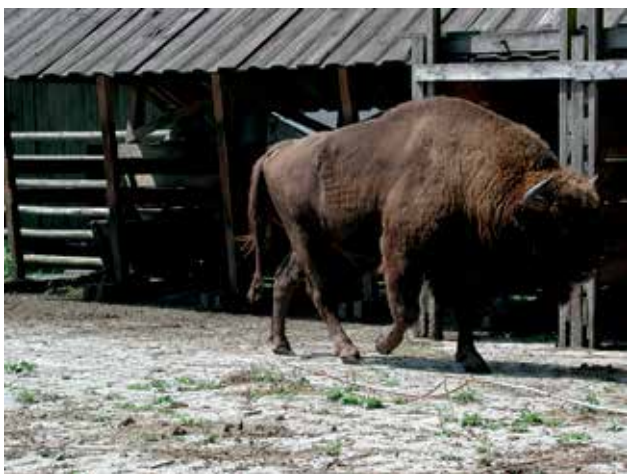
Ryc. 15. Żubr w rezerwacie w Wolińskim Parku Narodowym.

Na Wolinie, w ramach projektu restytucji puchacza, w latach 1993–1996 wypuszczono na wolność jedenaście osobników, pochodzących z różnych ogrodów zoologicznych, bowiem puchacz wyginął na wyspie Wolin już pod koniec XIX wieku. Spotkać