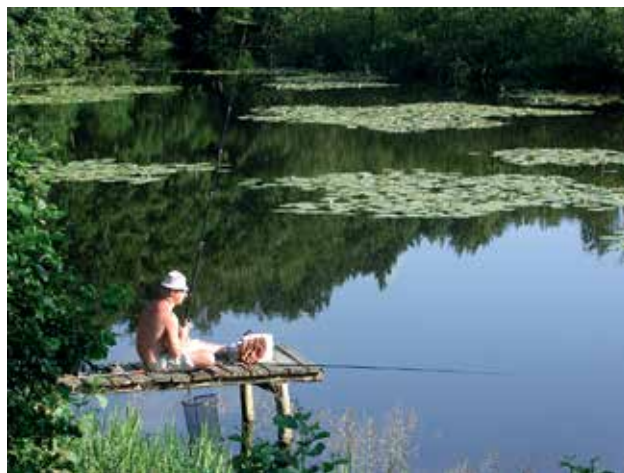
Ryc. 20. Unikatowe walory przyrodnicze obszarów Natura 2000.