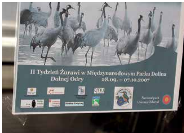
Ryc. 12. Plakat zapowiadający Tydzień Żurawi.

Dolina Dolnej Odry to ostoja wielu gatunków ptaków wodno-błotnych, zarówno w okresie lęgowym, wędrownym, jak i zimowiskowym, które występują tu w olbrzymich koncentracjach, np. na jesiennym zlotowisku zbiera się do 9000 żurawi. Na początku października 2007 roku odbył się w Parku Narodowym Dolina Dolnej Odry Tydzień Żurawi (Ryc. 12), w kooperacji z niemieckim Parkiem Narodowym Unteres Odertal. Wszyscy sympatycy żurawi mieli wprost idealne warunki do obserwacji, uczestnictwa w niezapomnianym spektaklu przyrody, w którym główną rolę grają żurawie. Ale Dolina Dolnej Odry to nie tylko żurawie, bowiem występują tu co najmniej