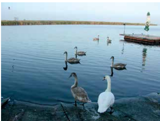
Ryc. 4. Łabędź krzykliwy.

Zalew – to ostoja wodno-błotnych ptaków o ran-