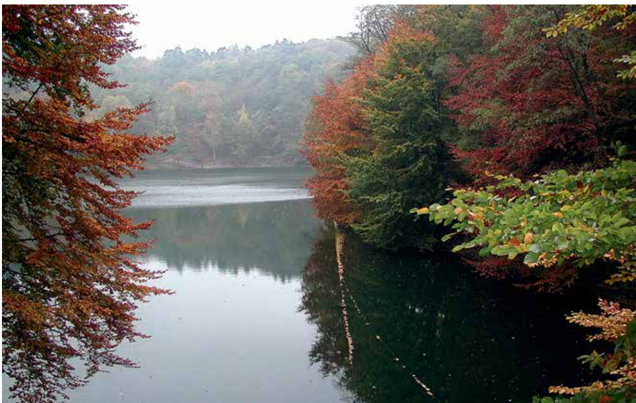
Ryc. 14. Jezioro Szmaragdowe w Szczecińskim Parku Krajobrazowym.

Wzgórza są porośnięte starym lasem bukowym, zwanym Puszcą Bukową, której unikatowe fragmenty przekształcone zostały w Szczeciński Park