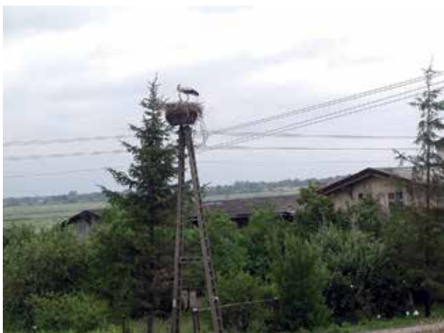
Ryc. 22. Unikatowe walory przyrodnicze obszarów Natura 2000 – bocian z pisklęciem.