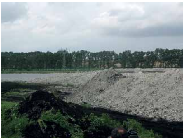
Ryc. 19. Kopalnia kredy jeziornej.