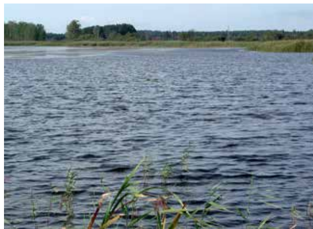
Ryc. 7. Jezioro Świdwie.

Wokół jeziora roztaczają się łąny szuwarów trzcinyowych, wilgotne łąki i olsy z zachowanymi rzadkimi przedstawicielami flory. Przebiegają tutaj szlaki ptasich wędrówek ze wschodu na zachód oraz z północy na południe.