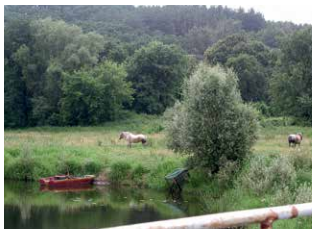
Ryc. 11. Unikatowe Kostrzyneckie Rozlewisko w pobliżu Cedyni.

W pobliżu Cedyni znajduje się Rozlewisko Kostrzyneckie (Ryc. 11), mające szczególne znaczenie dla ptactwa. Nie mniej istotne, jako lęgowiska dla ptaków drapieżnych, są lasy przylegające do doliny Odry.