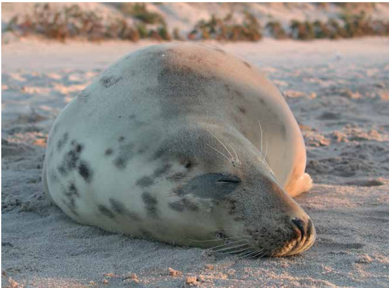
Ryc. 2. Foka szara – Depka na plaży w Mielnie.

W październiku 2007 r. czwórka podopiecznych profesora Krzysztofa Skóry – Gryf, Gafel, Głada i Dębek – została uwolniona w Czołpinie, na terenie Słowińskiego Parku Narodowego (Ryc. 3).