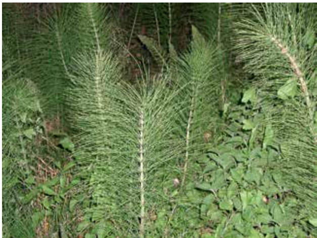
Ryc. 24. Unikatowe walory przyrodnicze obszarów Natura 2000 – skrzyp.

Alive – obserwacja czterech postaćów wiosny; bociana, jaskółki dymówki, jerzyka i kukułki.