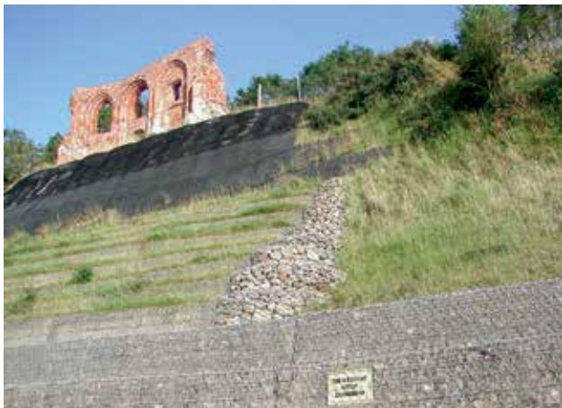
Ryc. 13. Ruiny kościoła gotyckiego w Trzęsaczu – umacnianie brzegu.

Znajdziemy tu zasolone łąki i pastwiska, wybrzeże klifowe, wydmy pokryte lasami, bory nadmorskie i wysokie torfowiska bałtyckie. Ostoja odznacza się