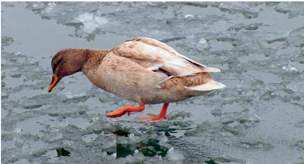
Ryc. 1. Kaczka krzyżówka w jaśniejszych barwach.

ubarwieniem od standardowej kaczki krzyżówki. Wiadomym jest, że w każdym gatunku mogą zdarzyć się osobniki odmienne kolorystycznie. Wśród ptaków najczęściej mamy do czynienia z leucyzmem, gdy