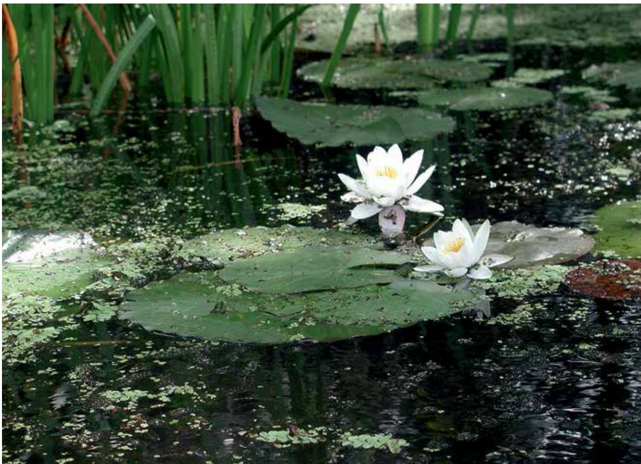
Ryc. 9. Grzybień biały.

zabudową brzegów rzek i jezior oraz kurczeniem się powierzchni starych drzewostanów. Gniazda bielików wymagają mocnych drzew jako podstawy. Nawet stuletnie drzewa nie zawsze spełniają te warunki.