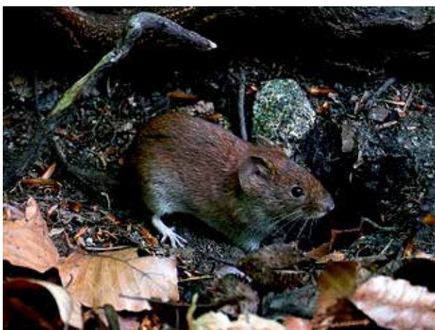
Ryc. 4. Samce nornicy rudej ( Myodes glareolus) są często nosicielami większej liczby pcheł niż samice tego gatunku. Zdjęcie wykonano 2 maja 2012 w Schannenbach, Odenwald, Niemcy.

Badania nad rolą płci żywiciela w kształtowaniu zgrupowań pcheł nie dają jednak jednoznacznych wyników. W warunkach laboratoryjnych pchły z gatunku Xenopsylla ramesis częściej notowane były na samcach niż na samicach myszokoczków ( Meriones crassus ). W swoich badaniach zaobserwowano większe zagęszczenie pcheł na samcach myszy polnej ( Apodemus agrarius ) i nornicy rudej ( Myodes glareolus ) (Ryc. 4), natomiast w przypadku myszy leśnej ( Apodemus flavicollis ) zagęszczenie pcheł było takie samo u samców i u samic. Podobnie na Słowacji zarejestrowano wyższe zagęszczenie i większą liczbę gatunków pcheł na samcach myszy polnej, nornicy rudej, ale także myszy leśnej. Z kolei w przypadku niektórych gryzoni z południowej Afryki i kilku gatunków nietoperzy z obszarów tropikalnych Ameryki Południowej, to samice były bardziej zarażone niż samce.