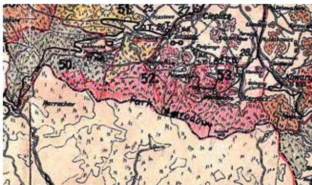
Ryc. 1. Wstępna granica KPN wg mapy z 1951 r.