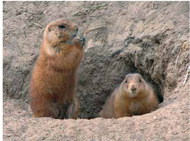
Ryc. 1. Rezerwuarem pałeczki dżumy ( Yersinia pestis ) w Stanach Zjednoczonych są m.in. pieski preriowe ( Cynomys ludovicianus ). Zdjęcie wykonano 18 kwietnia 2004 w zoo w Berlinie.

odchodami zarażonych tymi bakteriami gryzoni. Zwierzęta domowe i ludzie mogą się zarazić, zarówno poprzez ugryzienie pcheł, jak też kontakt z odchodami zainfekowanych gryzoni lub skażonymi przedmiotami. Koty mogą się zarazić także po zjedzeniu zarażonego gryzonia. Ponadto w przypadku dżumy płucnej ludzie mogą się zarażać drogą kropelkową.