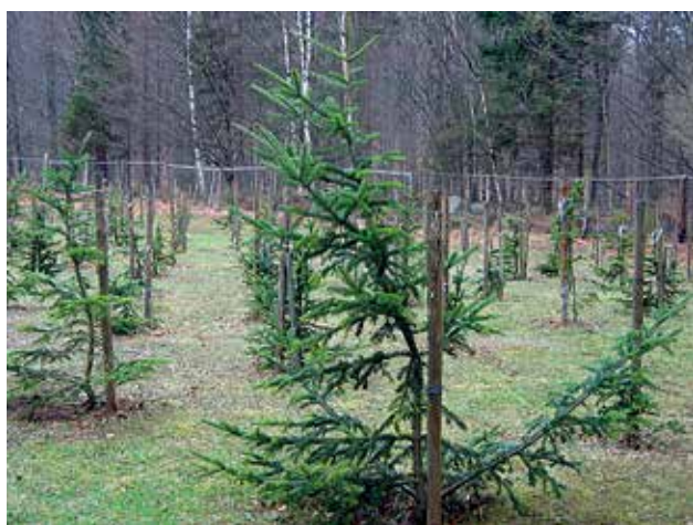
Ryc. 5. Plantacja jodły KPN w Jagniątkowie: szczepy na podkładce.