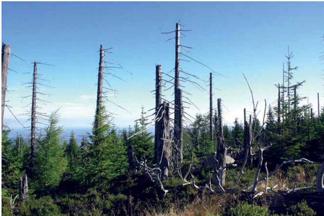
Ryc. 4. Naturalne odnowienia pokłeskowe przy górnej granicy lasu na Hutniczym Grzbiecie.

ogólnonarodową, a nie tylko resortową. Zagadnieniu temu poświęcone zostało wspólne posiedzenie Państwowej Rady Ochrony Przyrody i Rady Naukowej Karkonoskiego Parku Narodowego, które odbyło się 11–12.09.2014 r. w Karpaczu. Po wysłu-