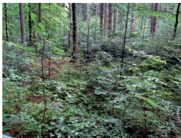
Ryc. 6. Restytucja jodły w dolnym przebiegu Piotrówki.

przebiegu granic Karkonoskiego Parku Narodowego stosownie do współczesnych wymogów, gdzie efekty ekonomiczne nie zawsze są najważniejsze. Przyroda jest bowiem wartością i własnością