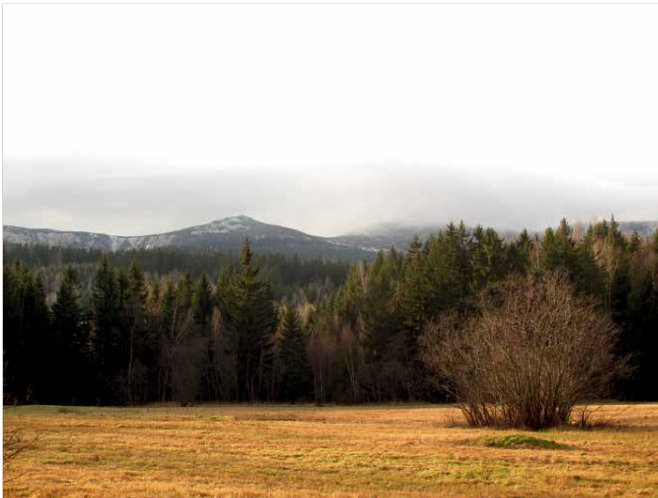
Ryc. 7. Łąkoć – Polana Widokowa przy dolnej granicy KPN nad Michałowicami.