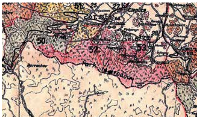
Ryc. 1. Wstępna granica KPN wg mapy z 1951 r.